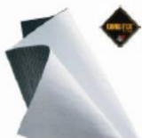
Forro Gore Tex® (WR)