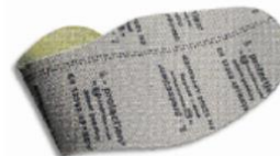
Plantilla anti perforación textil (P)