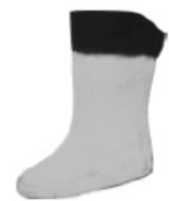
Bootie Gore Tex®