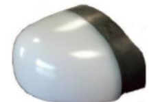
Puntera composite VINCAP®