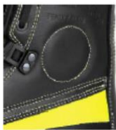
Protección de tobillo Reflectante ignífugo Doble cosido