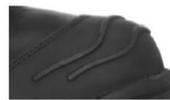
Nueva protección de puntera de caucho con resaltes