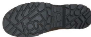
Suela de caucho/poliuretano Antideslizamiento, antiestática, resistente a hidrocarburos, ligera y más flexible