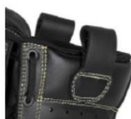
Tiradores mayores Lengüeta manejable y transpirable